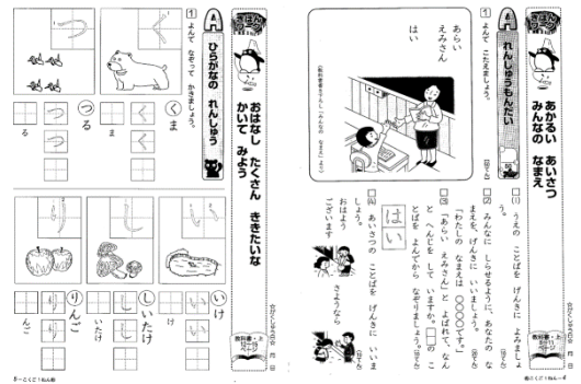
(「NEW小学生ワーク1ねんこくご」より)